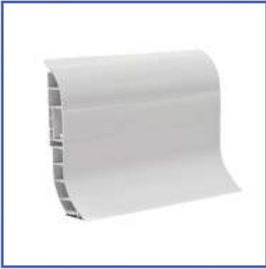
Hijyenik Dış Profil