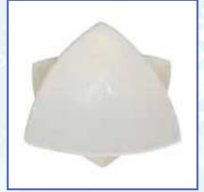
Yumurta Köşe Birleştirici