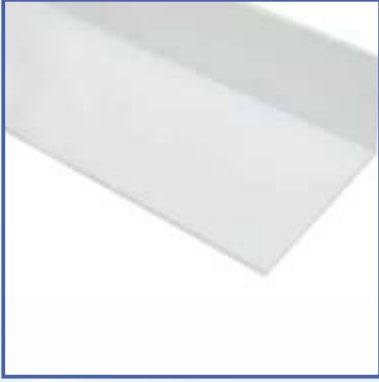
Köşeli İç ve Dış Profiller

Hijyenik soğuk oda aksesuarları, soğuk odalarda kalite ve hijyeni ön planda tutan bir tasarıma sahiptir. Özellikle gıda işletmelerinin ürün işleme ve depolama alanlarında istenilen hijyenik ortamı sağlamak ve HACCP gerekliliklerini yerine getirmek için kullanılan ürünlerdir.