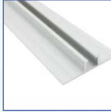
Tavan Askı Profili