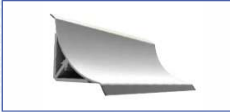
Hijyenik Dış Profil